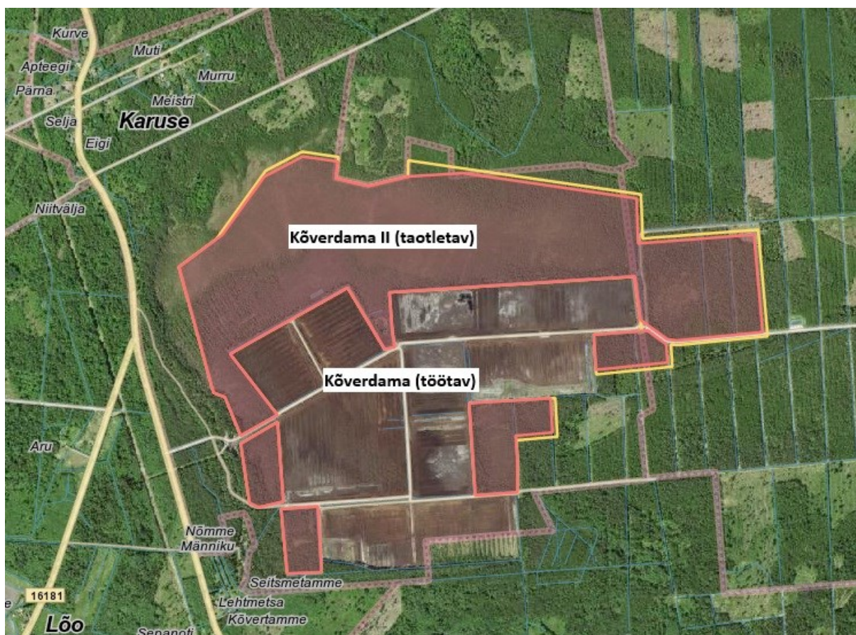
Joonis 1. Kõverdama II taotletav turbatootmisala (keskel töötav Kõverdama turbatootmisala).

KMH viidi läbi keskkonnanaloo (tegevusloa) andmise üle otsuse tegemiseks, sh loatingimuste määramiseks. KMH käigus hinnati planeeritava tegevuse ja selle reaalsete alternatiivsete võimaluste otseseid ning kaudseid olulisi mõjusid keskkonnamelementidele, inimese tervisele, heaolule ja varale. KMH käigus töötati välja keskkonnameetmed olulise keskkonnamõju vältimiseks või vähendamiseks. Keskkonnamõju hindas KMH juhtekspert ja eksperdirühm koos arendajaga.